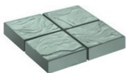
Толщиной 50 мм