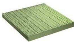
Толщиной 30 мм