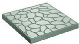
Толщиной 25 мм

Тротуарная плитка предназначена для благоустройства и декоративного оформления тротуаров, площадей, придомовых территорий, подходов к зданиям. Для её изготовления используют песчано-цементную смесь, которая в процессе обработки приобретает необходимый узор, форму, прочность и цвет. Кроме того, благодаря разнообразию расцветок плитка привлекательна внешне. В процессе укладки это позволяет создавать разные узоры, придавая дорожкам неповторимый вид. Всё это делает тротуарную плитку незаменимым материалом для обустройства улиц и придомовых территорий.