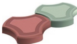
Толщиной 40 мм