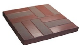
Толщиной 60 мм